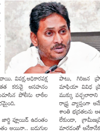
విజయవాడ, జూన్ 3, ప్రభాతవార్తా ప్రతినిధి:

జగన్ పర్యటనలో నిరసనల హోరు.. పరామర్శను అడ్డుకున్న దళిత సంఘాలు.. బతానగర్ ఉదంతంపై తీవ్రవిమర్శలు.. ప్రభాతవార్తా ప్రతినిధి-విజయవాడ బ్యూరో: ఆంధ్రా పోలీస్, కళంకాణి తెనాలి.. ప్రస్తుతం రాజకీయ నిర్ణయ కుంభాకారంగా మారింది. అధికారి, ప్రతిపక్ష పార్టీల రాజకీయ కేళి, బలాబల వ్యవహారాల వేగం, వైసీపీ అధినేత, మాజీ ముఖ్యమంత్రి వై.ఎస్.జగన్ మంగళవారం తెనాలి పర్యటనకు రావడంతో తీవ్ర ఉద్రిక్త, ఉద్విగ్న పరిస్థితులు లోనైంది. వై.ఎస్.జగన్ పరామర్శ పర్యటనకు, ప్రత్యామ్నాయంగా దళిత సంఘాల ధర్మాలు, రాస్తాలోకాలు, మానవహారాలు, నిరసనలు పట్టు వాతావరణాన్ని ఒక్కసారిగా వేదెక్కించాయి. విప్లవ అధికారపక్ష తప్పడం లేదు. జ్యోతి బతానగర్ లో జీవల వెలుగుచూసిన పోలీసు లాల్ విన్యాసం ఇంకా పోలీసు రాజకీయ లక్షి ఆయనచే వరమైంది. >>2