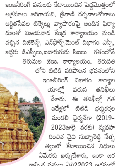
తిరుమల తిరుపతి దేవస్థానం

ప్రభాతవార్తా ప్రతినిధి-తిరుమల: కొండనాలుకకు మండేస్తే ఉన్ననాలుక ఉడిందనే చందంగా హిందూ ధార్మిక సంస్థ తిరుమల తిరుపతి దేవస్థానం చరిత్రలో తొలిసారిగా పదినిలల క్రీందట ప్రభుత్వ విజిటివ్స్ ఎన్ ఫోర్స్ మెంట్ అధికారులు చర్యలు చేసిన సోదాల వివరాలు ఏమయ్యాయోనే తెలుసుకోవాలి. గత వివరాలలో ఎంత వరకు అక్రమాలు జరిగాయి? ఏమిట నేటి పూర్తిస్థాయిలో బయటకు రాలేదు. పైగా మళ్లీ ఇప్పుడు తులాభారం అక్రమాలు ఏమిటనేది ఉద్దేశ్యంపై పోలీసులు పరీక్షించారు. తిరుమల వేంకటేశ్వరస్వామికి భక్తులు కానుకగా సమర్పించే కోట్లరూపాయలు నిధులు వడ్డీకాసులవారి ఖజానాకు చేరుతాయి. ఈ ఖజానా నుండి గత ఐదేళ్ల వైసిపి ప్రభుత్వంలో నిధులు దుబాబా చేశారని, లెక్కలు మించి ఇంజనీరింగ్ పనులు నిధులు కేటాయించారనే ఆరోపణలపై రాష్ట్ర విజిటివ్స్ ఎన్ ఫోర్స్ మెంట్ గతంలో అధికారులు సోదాలు చేశారు. టిటిడిలో నిధుల దుబాబాపై, >>2