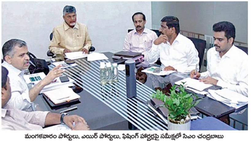
మంగళవారం పోర్టులు, ఎయిర్ పోర్టులు, ఫిషింగ్ హోర్సర్లు సమీక్షలో సిఎం చంద్రబాబు

తొలిదశలో అమరావతి, కుప్పం, దగదర్తి, శ్రీకాకుళం ఎయిర్పోర్టుల నిర్మాణం పిపిపి విధానంలో రహదార్లు విస్తరణ జాతీయ రహదారులతో అన్ని రాష్ట్ర రహదారులు అనుసంధానం పోర్టుల నిర్వహణపై సమీక్షలో సిఎం చంద్రబాబు