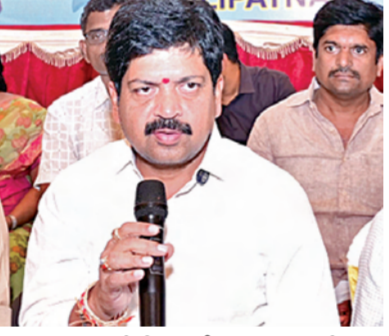
మంగళవారం మీడియాతో మంత్రి కొల్లు రవీంద్ర

జాతీయ స్థాయిలో అద్భుతంగా నిర్వహిస్తాం: మంత్రి కొల్లు రవీంద్ర